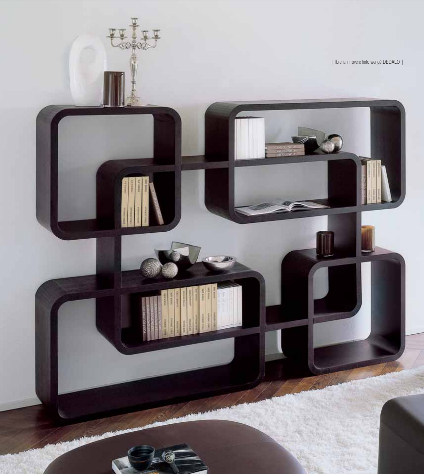
| libreria in rovere tinto wengè DEDALO |