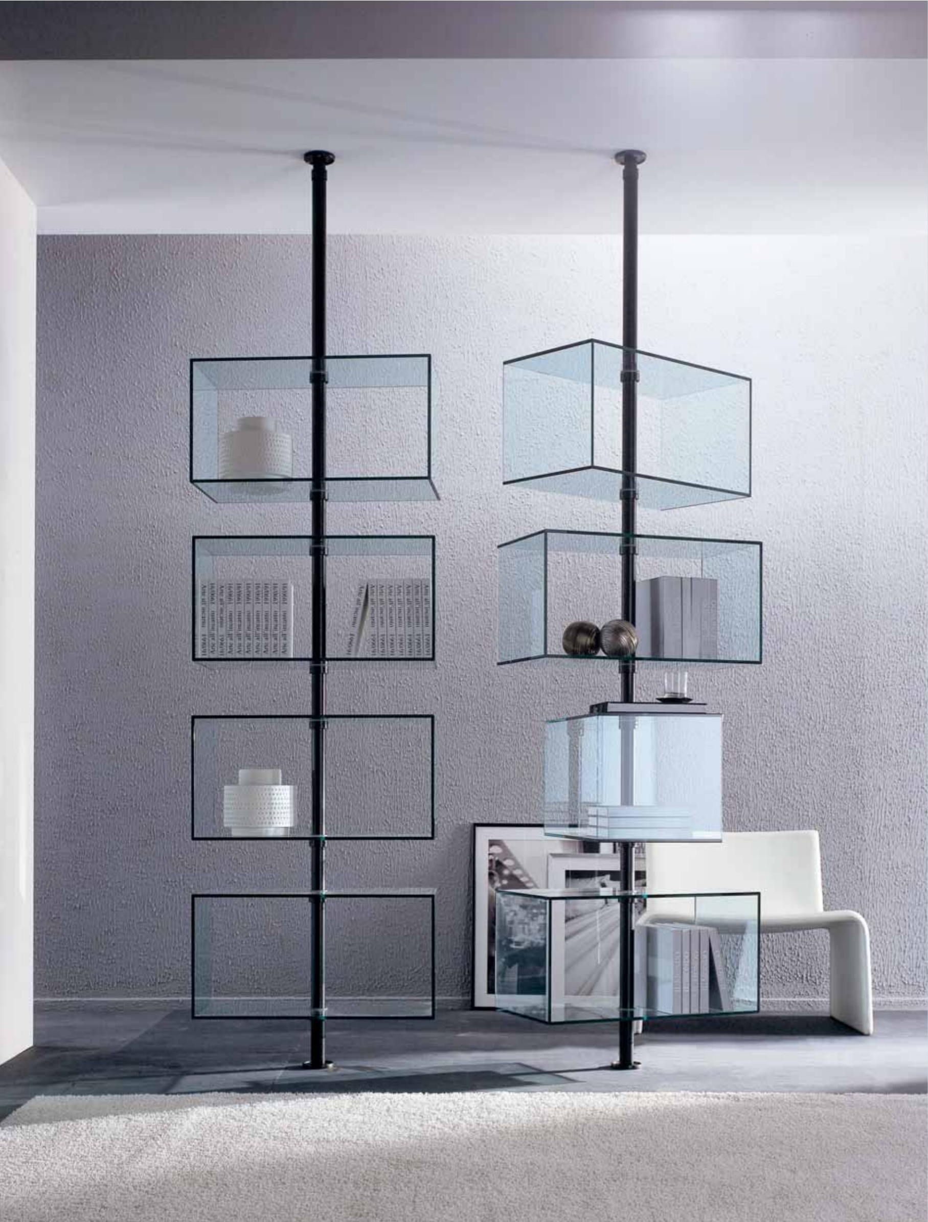
| libreria in cristallo trasparente metallo brown DOMINO |